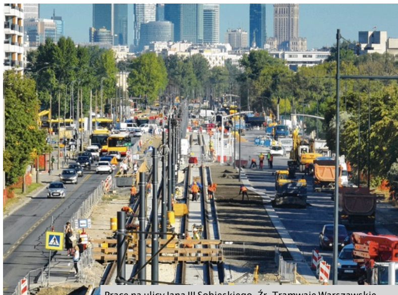
Prace na ulicy Jana III Sobieskiego.

Ratusz i Tramwaje Warszawskie zapewniają, że wyciągną konsekwencje od Budimexu w związku z kolejnym opóźnieniem oddania inwestycji do użytku. Z kolei wykonawca tłumaczy, że prace te zleco-