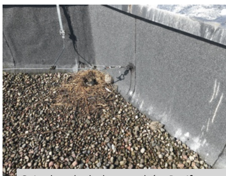
Gniazdo na budynku przy ul. św. Bonifacego.

- Tendencję do coraz częstszego gnieżdżenia się mew na budynkach na śródlądziu obserwujemy na przestrzeni ostatnich lat w całej Europie. Dla przykładu, na Białorusi na dachu hali przemysłowej funkcjonuje kolonia której liczebność przekracza 1000 par. Do te-